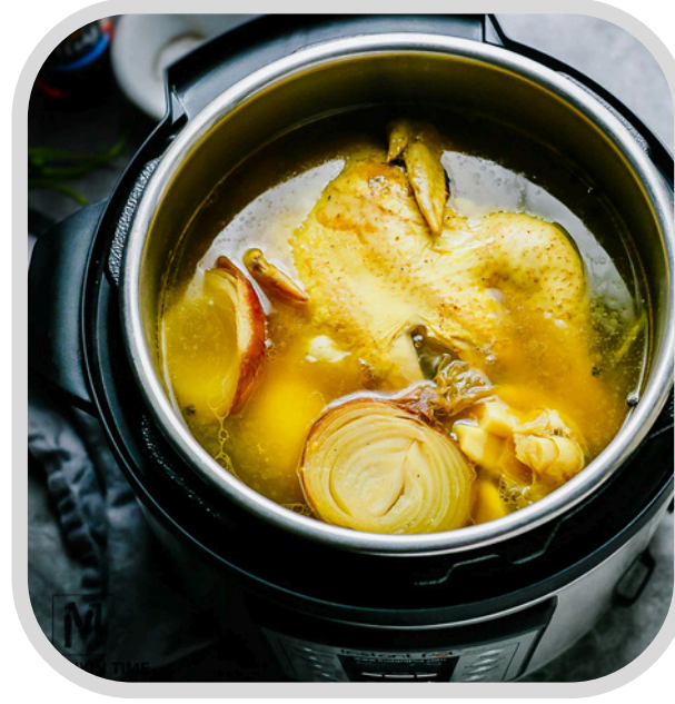
حساء عظام الدجاج Chicken Bone Broth