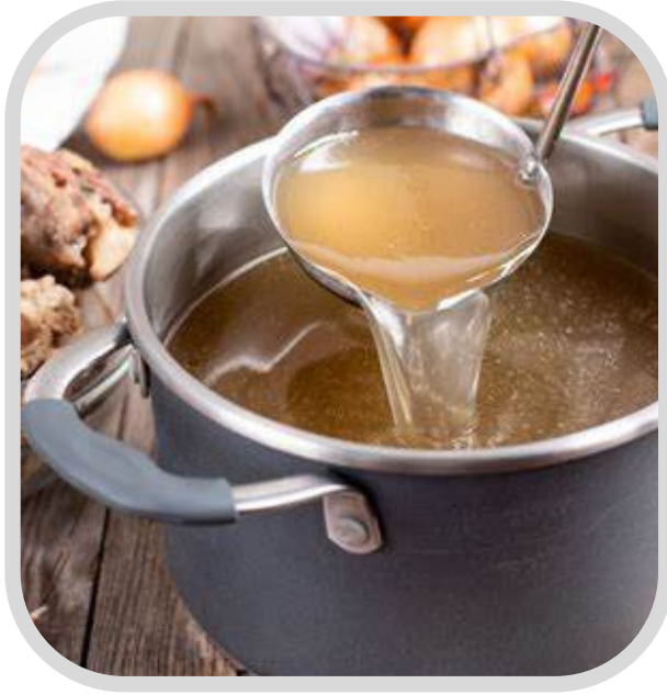
حساء عظام اللحم البقري Beef Bone Broth